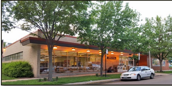
Չիկագոյի հանրային գրադարանի «Բեզազեան» մասնաճյուղը